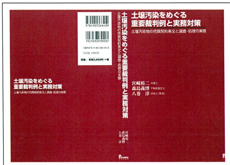
土壌汚染をめぐる重要裁判例と実務対策