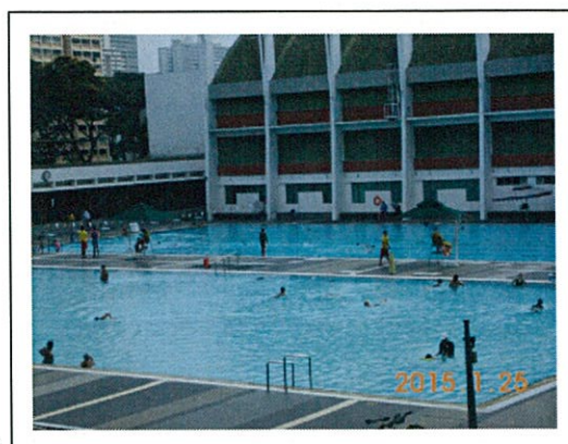
日本では真冬なのに