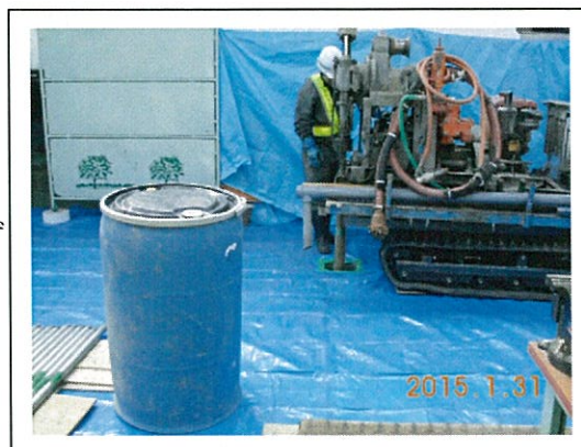
A市B工場ボーリング調査