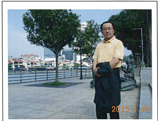
クラークキーエリアにて