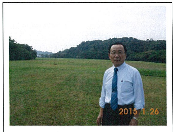
国際入札の工場跡地サイト