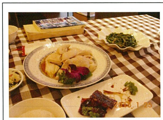
名物料理のチキンライス